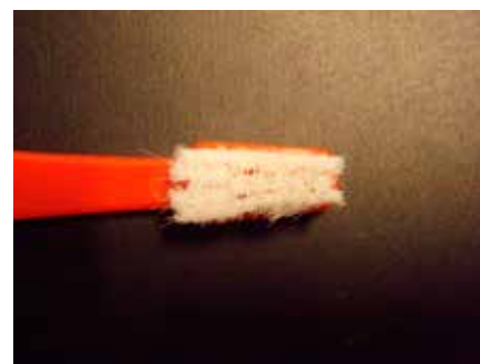
Kirurgisk børste (Mega Soft) med mere end 12.000 børstehår

Når vi som dyrlæger kan tilbyde den samlede "palet" af lege artis tandbehandling, værktøj til hjemmeprofylakse, instruktion, motivering og opfølgning – så opnår vi den maximale effekt til gavn for mundhulens sundhedstilstand hos vores kæledyr.