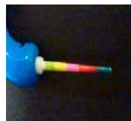
Probe til at vurdere interdental rummet. Farvekode som passer til børsterne