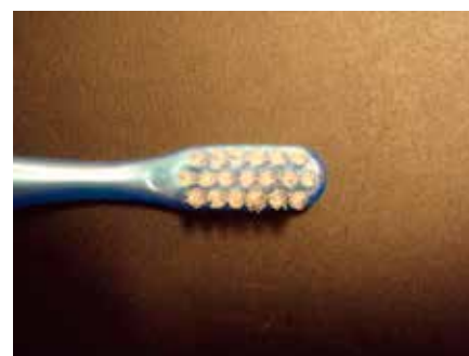
Nylon børste med omkring 800 børstehår