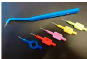
Interdental børster. Farvekode angiver størrelsen/bredden på børsten

Tandpasta er tilsat slibemiddel og har derfor en positiv indvirkning på effektiviteten af tandbørstningen. Til ukomplicerede inflammationstilstande og til ren profylakse anbefaler jeg en tandpasta med slibemiddel og motiverende smag. På TandDyreklinikken sæl-